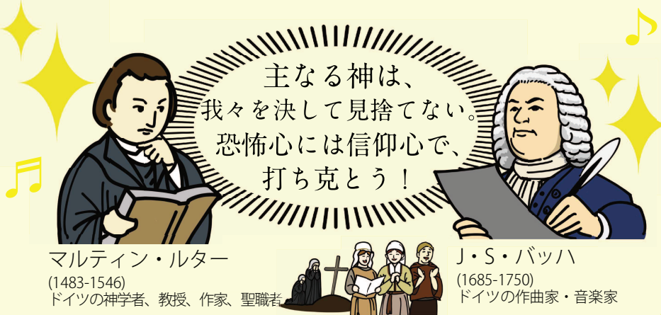
マルティン・ルター (1483-1546) ドイツの神学者、教授、作家、聖職者

ペストは今から約700年前、1348年を中心にヨーロッパで猛威を振るい、その死亡率は人口の3分の1に及んだといわれています。その後も4世紀に亘り、周期的に何度も発生し、大量死をもたらしました。“神の怒り”を感じた、当時の聖職者や音楽家たちは、神を讃える歌（カンタータ）を数多くつくり、ペストの恐怖から人々を守りました。