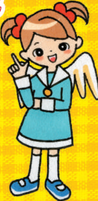
マナー天使のマナちゃん

「しっかりしてるね!」って先生やおうちの人に言われたらうれしいよね! そんな自分になるには、自分勝手な「〇〇したい」「〇〇がほしい」という心をおさえて“心のコントロール”をすることが大切☆ キミはできているかな? おうちの人と一緒にチェックしてみよう!